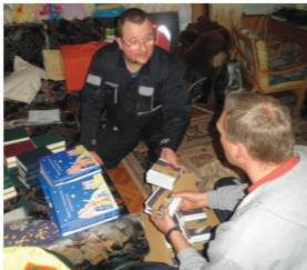
A Bibliatársulat kiadványai megérkeztek Devecserre