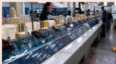
A Brazil Bibliatársulat nyomdája, ahol a Bibliák készülnek

Egy igen különlegesnek számító eredményt értek el a Brazil Bibliatársulatnál: júniusban kikerült a nyomdából a százmilliomodik Biblia! Ennek a mérföldkönek a megünneplését egy nagy hálaadó eseményen tartották június 10-én és ezzel egy időben a Brazil Bibliatársulat fennállásának hatvanharmadik évfor-