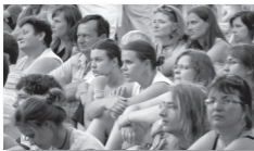
Részvevők a Csillagpont Ifjúsági Találkozón

A Református Ifjúsági Találkozót idén Tán rendezik meg július 19–23. között, témája: „Érintések”.