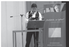
Felolvasó a Deák téren 2010-ben

Hagyományt szeretnénk teremteni a már 2010-ben is megrendezett pünkösdhétfői Biblia-felolvasással. A több keresztyén felekezet részvételével tartandó bibliaolvasás idén is a rendező-szervező Magyar Bibliatársulat, a Református Közéleti és Kulturális Központ, illetve a Kálvin és a Luther Kiadó közös programja. Helyszíne a budapesti Deák téri evangélikus templom lépcsőjén kialakított pódium lesz. A rendezvény alap gondolata az, hogy valóságosan is kivigyűk a Biblia szavait az utcán járó emberek közé úgy, ahogyan az az első pünkösöd alkalmával történt. Tavaly a résztvevők tizenhat nyelven olvastak fel a Szentírásból. Az idei évben az ország Európai Unió elnökségéről megemlékezve, az Unió összes hivatalos nyelvén felolvasunk egy-egy részt a Szentírásból. A Bibliát gimnazisták, egyetemisták, művészek, sportolók, politikusok és egyházi szervezetek tagjai olvassák majd fel.