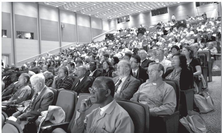
A Bibliatársulatok Világszövetségének nyolcadik világgyűlése Szöulban