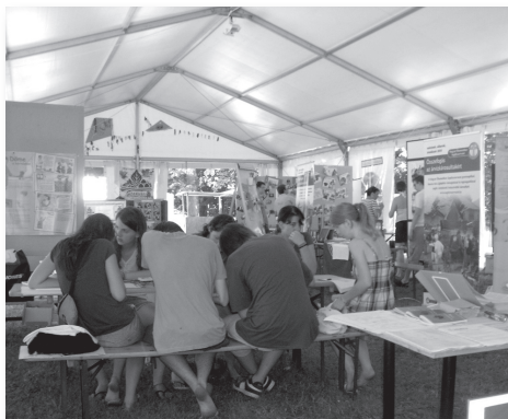
Az MBTA sátra a „Szélrózsán”

Volt komoly része is az ottlétünknek, ugyanis magunkkal hoztuk a hazai kórhá-